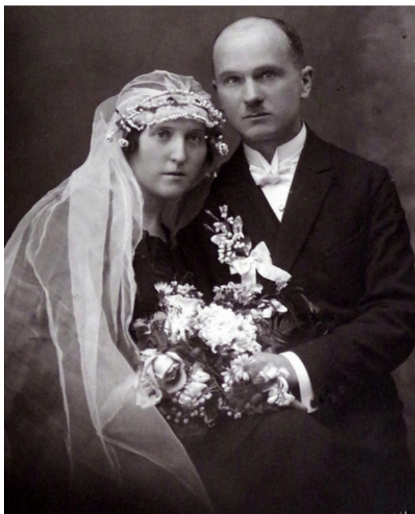
Zelov – svatba rodičů.