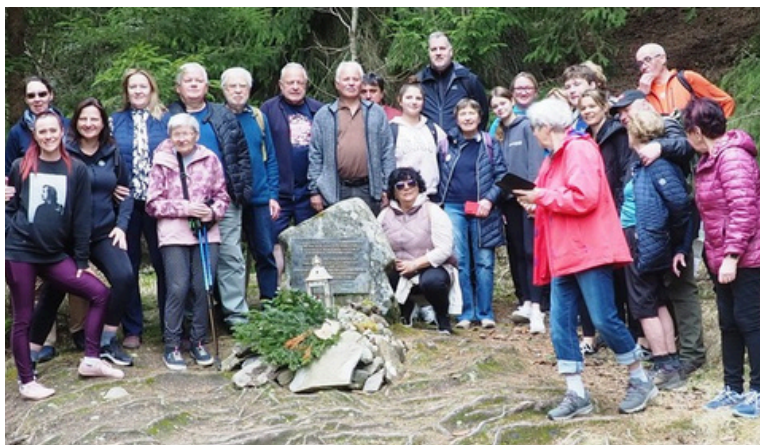
Místo posledního přechodu „Krále Šumavy“.