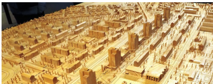
Sídliště Kladno-Rozdělův, vlevo realizace podle Marschallova plánu.