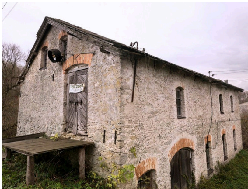
Buderáž - vodní mlýn z roku 1936 - snímek z roku 2019.