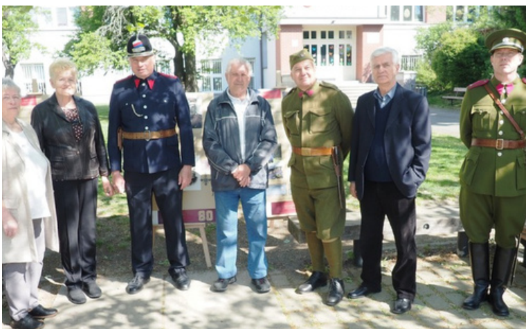
Pieta 5. 5. 2026 - s policisty a vojáky v dobových uniformách.