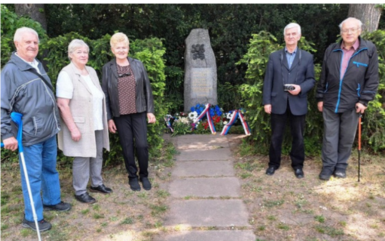
Pieta 5. května 2026 - naše delegace u památníku (ZŠ Pražačka).