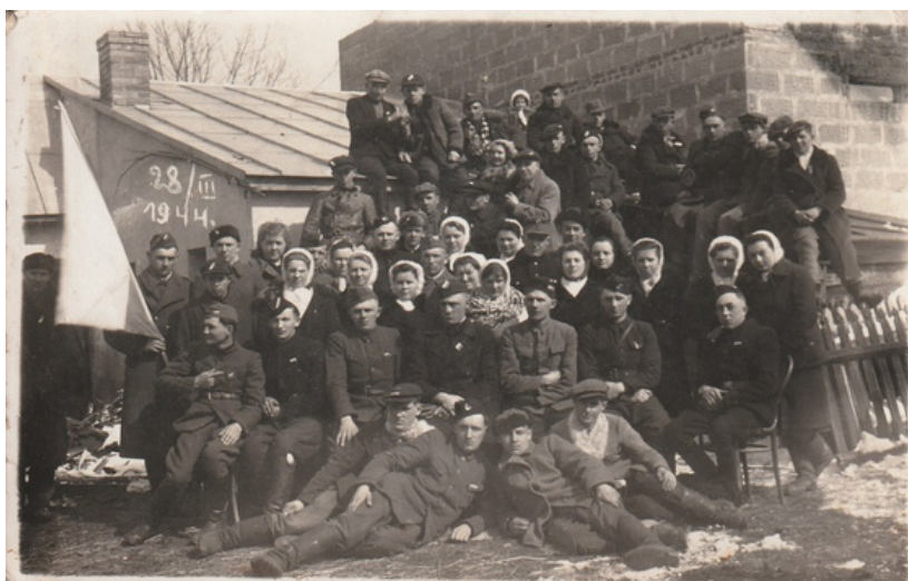
Buderáž 28. 3. 1944 - odchod do války