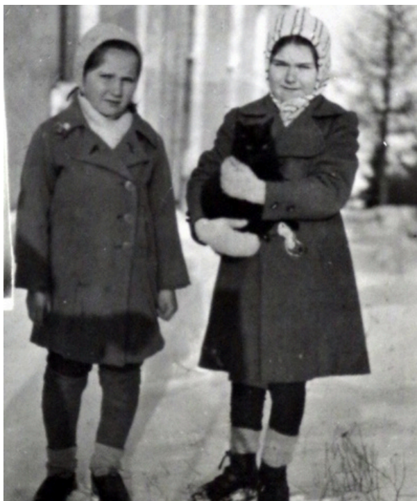
Rut a Světluše na Volyni.

a to také dodrželi." Když Sovětům šel tatínek ukázat cestu, vrátil se bez hodinek a prstýnku (s namířeným samopalem mu řekli: „dávaj“). Němci i Banderovci se chovali stejně. Střety mezi Sověty a Banderovci pokračovaly i po skončení války, takže klid zde nenastal a naše touha po návratu do pravlasti sílila.“